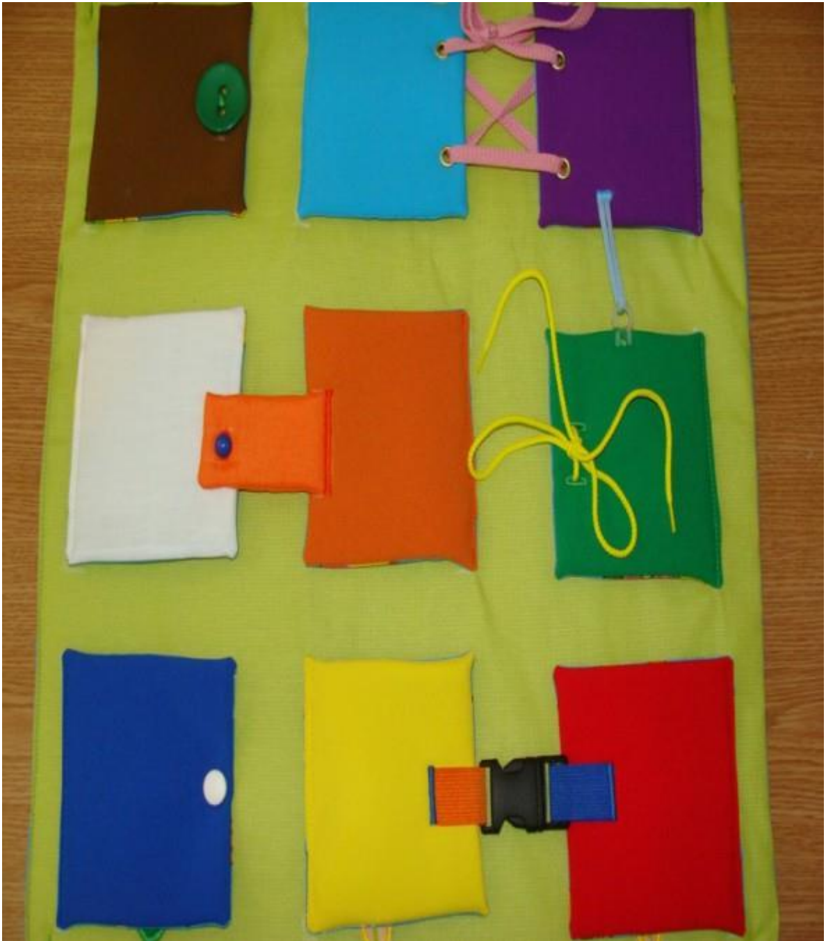
Панно «Найди пару».

Цель данного пособия: развитие умения узнавать и называть цвета и размер предмета. Развитие мелкой моторики пальцев рук. Развитие умения детей в нахождении одинаковых предметов.