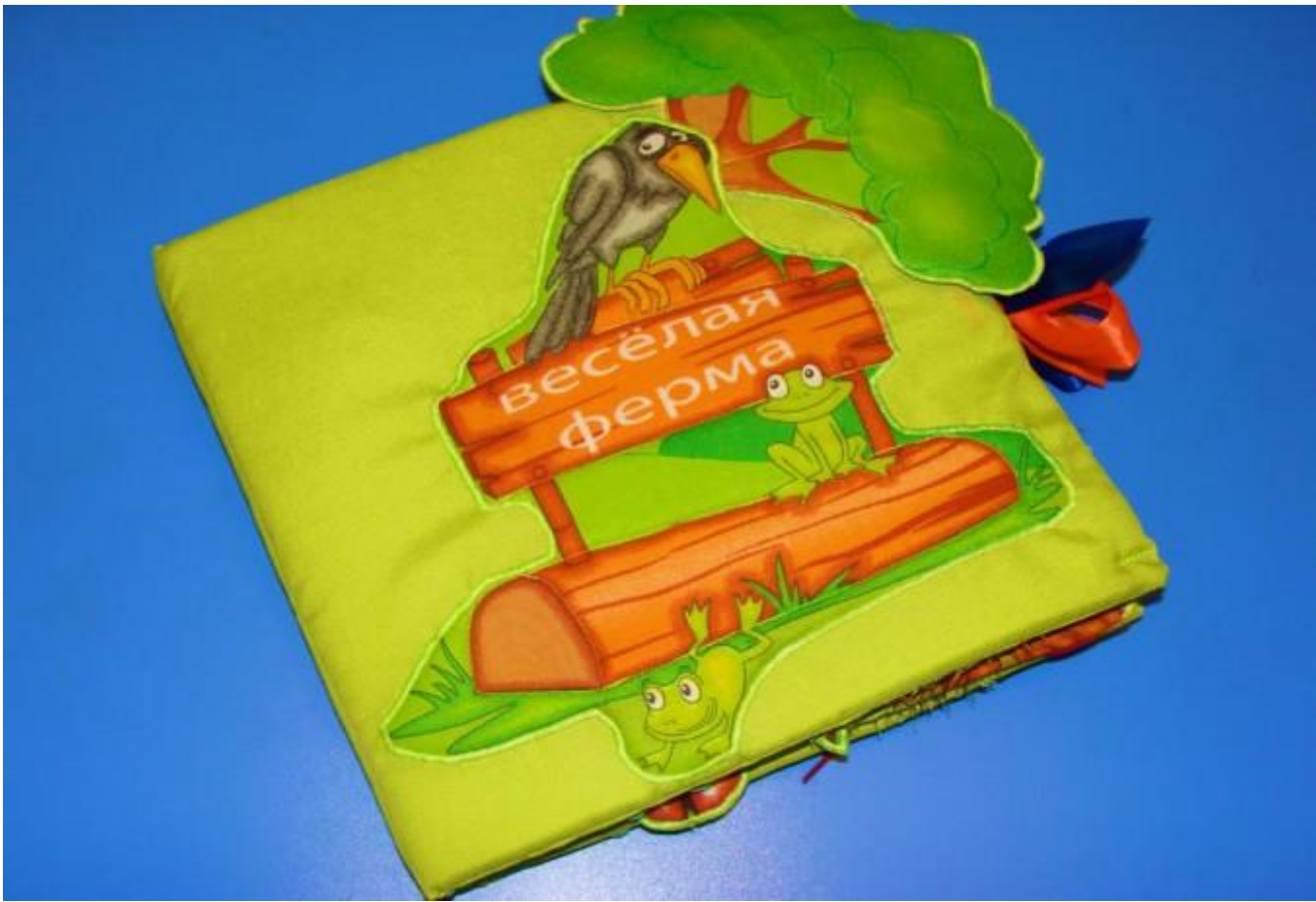
Книжка-раскладушка «Весёлая ферма».